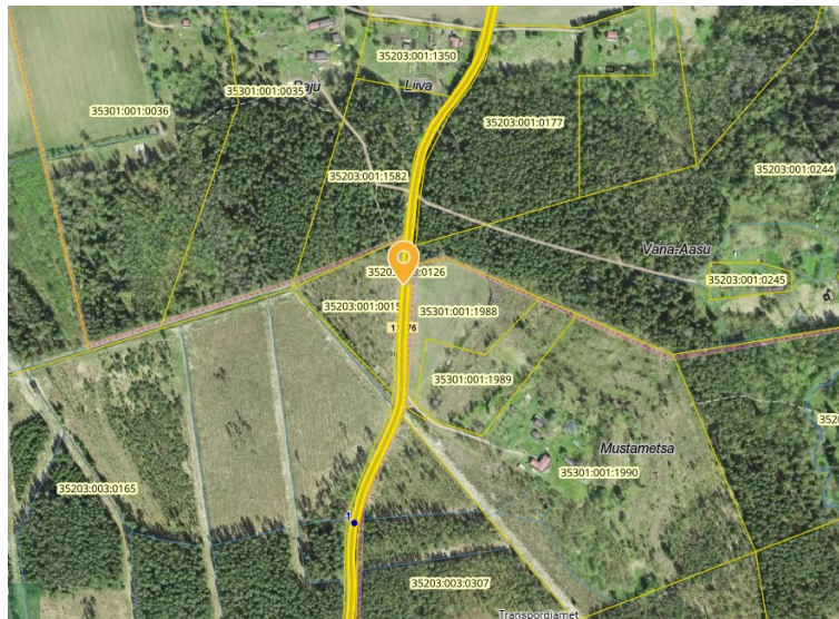
Ristumiskoht riigitee nr 11276 Vahastu-Mustametsa tee km 1,27